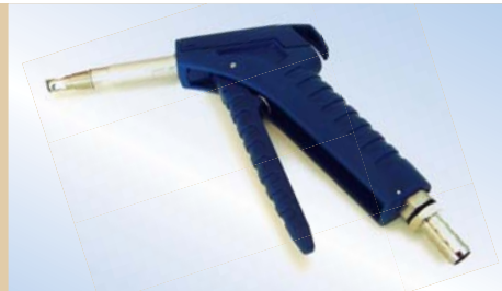
Bates Flex Inflator med 80 mm rør, varenr. 096048

Click-on: Bates Flex Inflator kan leveres med click-on. Fordelen ved click-on er, at fyldepistolen kan fastlåses til ventilen, således at luftpuden kan fyldes ved brug af kun en hånd. Efter fyldning frigøres fyldepistolen ved et let tryk på låsepalen.