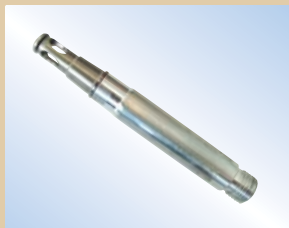
Fyldespids, Flex Inflator, aluminium, 80 mm Varenr.:..... 096040