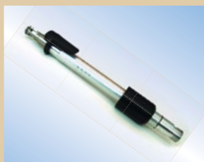
Fyldespids, Flex Inflator, aluminium, 150 mm, med click-on og air-release Varenr.:..... 096228