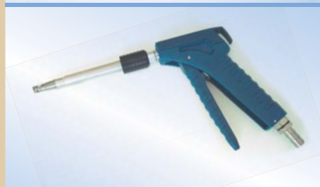
Bates Flex Inflator 150 mm med air-release rør, varenr. 096059