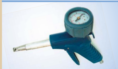
Bates Flex Inflator med Ø 40 mm manometer, varenr. 096049