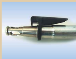
Fyldespids, Flex Inflator, aluminium, 80 mm, med click-on Varenr.:..... 096240