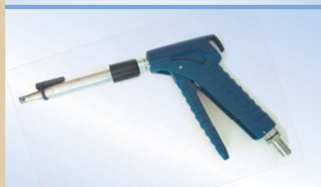
Bates Flex Inflator med click-on og air-release, varenr. 096259