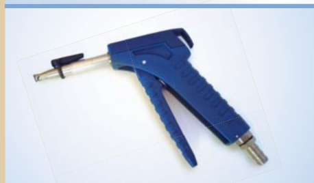
Bates Flex Inflator med click-on, varenr. 096248