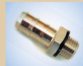
3/8" slangenippel til Flex Inflator Varenr.:..... 096057