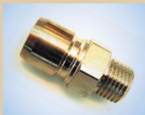
Hankobling til Standard/Flex Inflator og Quick Inflator (monteres på inflator for hurtigt skift mellem inflators) Varenr.:..... 096069