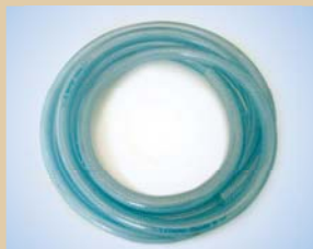
1/2" slange (50 m) Varenr.:..... 096035 3/8" slange (50 m) Varenr.:..... 096031