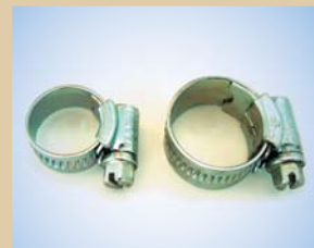
1/2" spændebånd Varenr.:..... 096036 3/8" spændebånd Varenr.:..... 096033